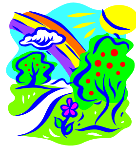
Οι τελευταίοι ήρωες, Λίσα Ψαράυτη