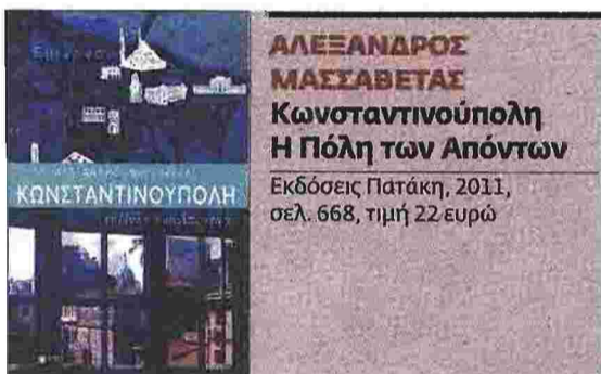
ΑΛΕΞΑΝΔΡΟΣ ΜΑΣΣΑΒΕΤΑΣ Κωνσταντινούπολη Η Πόλη των Απόντων Εκδόσεις Πατάκη, 2011, σελ. 668, τιμή 22 ευρώ