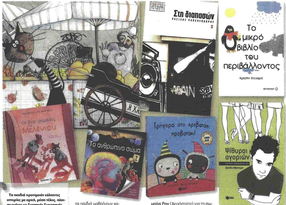
Τα παιδιά προτιμούν ελπίστες ιστορίες με αρχή, μέση τέλος, παισιωμένες με ζωντανές ζωγραφιές

Στις εκδόσεις για την προσχολική ηλικία κυριαρχούν μικρά ζώα που συχνά μεταφέρουν μνύματα. Πολλά είναι οικολογικά: «Το μικρό βιβλίο του περιβάλλοντος» της Κριστίν Κουαρό (Μεταίχιμο), η «Πρασινοσκουφίτσα και το φλεγόμενο δάσος» (Ψυχογιός), «Παιδιά σε δράση» του Β. Ηλιόπουλου (Πατάκης). Αλλά δίνουν συμβουλές κάθε είδους: «Προβατάκι, γρήγορα στο κρεβάτι» (Πατάκης), «Το αρκούδακι μοιράζεται» της Αλίσσον Ρέινολντς (Μεταίχιμο, εικονογράφηση Λι Κρούτση), «Φρόλο, φρόνιμο» του Τζ. Στέλλα (Πατάκης, εικ. Μ. Αντι), όπου