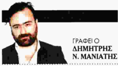
ΓΡΑΦΕΙΟ ΔΗΜΗΤΡΗΣ Ν. ΜΑΝΙΑΤΗΣ