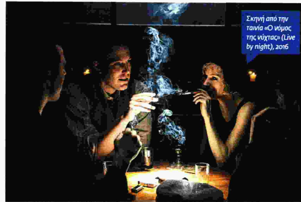
Σκηνή από την ταινία «Ο νόμος της νύχτας» ( Live by night ), 2016

Μπορούμε να πούμε πως ο Ντένις Λεχέιν ακολουθεί τα ίχνη του άλλου σπουδαίου αμερικανού συγγραφέα, του Τζέιμς Ελρόι, ο οποίος επίσης χρησιμοποιεί την αμερικανική ιστορία για να μιλήσει για τους ανθρώπους του εγκλήματος. Οι δυο τους όμως έχουν και σημαντικές διαφορές, δεδομένου ότι ο δεύτερος έχει ένα δικό του