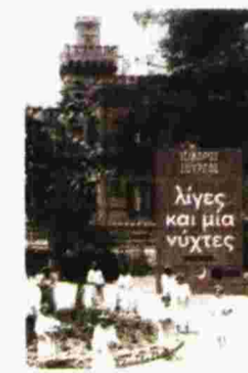
Ισίδωρος Ζουργός ΛΙΓΕΣ ΚΑΙ ΜΙΑ ΝΥΧΤΕΣ Εκδ. Πατάκη, 2017 Τιμή: 20 ευρώ

ακροβατεί μεταξύ μύθου και πραγματικότητας. Αγγίζει τις αστοχίες, τα λάθη και τα πάθη που σπρώχνουν κάποιον να γράψει κάτι στο χαρτί, αποτυπώνοντας ο ίδιος τον μυστικό δρόμο που πρέπει να ακολουθεί ένα βιβλίο: «Σας ταξιδεύει; Η γλώσσα έχει κραδασμούς ή κοιμάται όρθια; Η φύση μυρίζει μέσα από τις σελίδες του; Οι έρωτές του ιδρώνουν ή είναι αποστειρωμένοι;» «Ένα καλό μυθιστόρημα πρέπει να προσέχει ιδιαίτερα τις δοσολογίες (...) Σαν τα μπαχαρικά: με αυστηρό μέτρο...» και ο Ζουργός μοιράζει ακριβοδίκαια την έμπνευσή του στον βίο ενός ανθρώπου, που αδειάζει την κλεψύδρα της ζωής του στις σελίδες ενός βιβλίου και στη γραμμική διαδρομή της Θεσσαλονίκης, της πόλης που στέκει αιώνιος θεατής των θνητών ζώων που κυλούν στις φλέβες της.