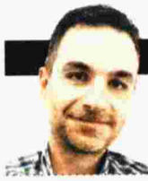
ΓΡΑΦΕΙ Ο ΓΙΑΝΝΗΣ ΜΠΕΛΕΚΑΣ

Χ ρόνος αναφοράς το 1909. Η άλλοτε κραταιά Οθωμανική Αυτοκρατορία οδεύει προς τον ανεπίστρεπτο δρόμο της διάλυσης. Το κίνημα των Νεότουρκων επιβάλλει τη θέλησή του στην Πύλη. Ο σουλτάνος Αβδούλ Χαμίτ Β' (ο Καταραμένος) εκθρονίζεται και εξορίζεται στη Θεσσαλονίκη, έδρα των τούρκων εθνικιστών, προκειμένου να ζήσει έγκλειστος στη βίλα Αλλατίνι. Ο Λευτέρης Ζεύγος, ένα