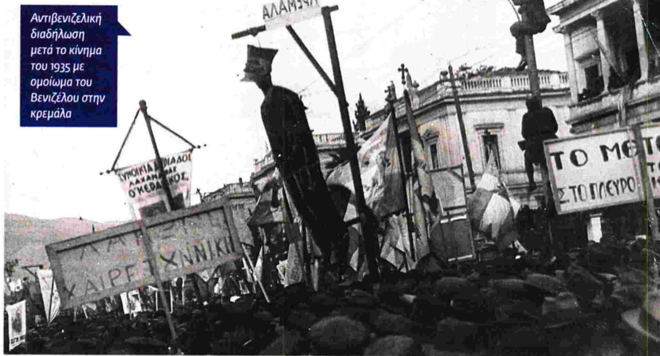
Αντιβενιζελική διαδήλωση μετά το κίνημα του 1935 με ομοίωμα του Βενιζέλου στην κρεμάλα

Όπως και εκεί, ο Μαυρογορδάτος δεν διστάζει να λάβει σαφή θέση υπέρ του Ελευθερίου Βενιζέλου , τονίζοντας ότι «τα πράγματα είναι εκείνα που “μεροληπιτούν”, όχι εγώ». «Μόνο στην περίπτωση του Βενιζελισμού μπορεί να γίνει λόγος για συγκροτημένη πολιτική, με συγκεκριμένους στόχους και μέτρα για την επίτευξή τους. Με μία φράση, κεντρικός άξονας της πολιτικής αυτής ήταν η οικοδόμηση σύγχρονου εθνικού κράτους φιλελεύθερων ευρωπαϊκών προδιαγραφών σε συνθήκες ειρήνης και με σεβασμό στη διεθνή νομιμότητα, όπως τότε εκφραζόταν από την ΚτΕ» γράφει χαρακτηριστικά. Ενάντια σε αυτήν, χωρίς ουσιαστικό όραμα και πρόγραμμα εκτός από τον «εσωστρεφή πατριωτισμό της Παλαιάς Ελλάδας», τίθεται ο αντιβενιζελισμός, μια «βαθύτατα οπισθοδρομική και ρομαντική αντίδραση» που «συσπειρώνει και ενσαρκώνει τις κάθε λογής αντιστάσεις και αντιδράσεις στην εθνική ολοκλήρωση και στο σύγχρονο εθνικό κράτος. Ενσαρκώνει προπαντός την επιθετικότητα των γηγενών εναντίον των προσφύγων». Και όταν υπόσχεται προστασία σε εθνικές ή θρησκευτικές μειονότητες, το κάνει