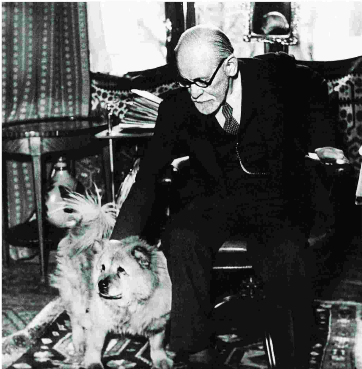
Ο Σίγκμουντ Φρόντ είναι πιο επίκαιρος από ποτέ, ιδίως στις σκοτεινές και πολυμένες εποχές που διανύουμε, στοιχεία με τα οποία πάλεψε ο ίδιος.

Πολλές δεκάδες βιογραφίες έχουν γραφεί για τον Φρόντ, από την πρώτη που δημοσιεύθηκε ενόσω ζούσε ακόμα, το 1934, από τον μαθητή του Φρίτς Βίτελς, μέχρι εκείνη του Πίτερ Γκέι το 1988. Ενδιάμεσως, η πιο γνωστή, και στα ελληνικά γράμματα, είναι η βιογραφία του φίλου του Ερνέστ Τζόουνς (η οποία εκδόθηκε στα ελληνικά, τρίτομο έργο που συμπιτύχθηκε για χάρη της ελληνικής έκδοσης, από τις εκδόσεις Ινδικτός) και η οποία από το 1970 και μετά τέθηκε σε αμφοβήτωση.