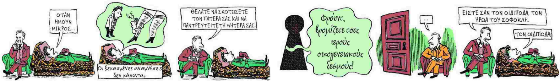
Στο graphic novel των Κορίν Μάιερ και Αν Σιμόν, ο ίδιος ο Φρόντ «συμπράττει» συστήνοντας στους αναγνώστες μερικά από τα κομβικής σημασίας στοιχεία της ζωής και του έργου του.