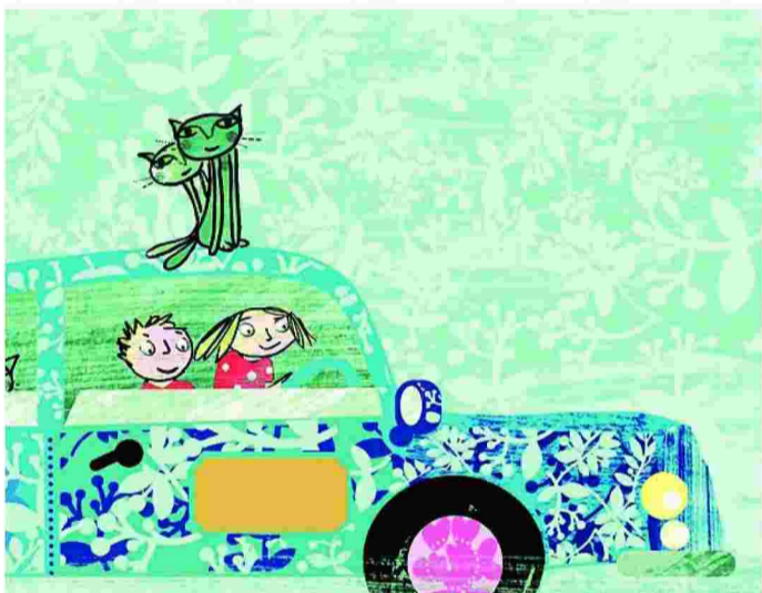
Ιδιοφυές εικονογραφικό το βιβλίο «Όλοι μαζί στον μπλε καναπέ» έχει πιθανότητες να συμπεριληφθεί στα κλασικά της λογοτεχνίας για μικρά παιδιά.