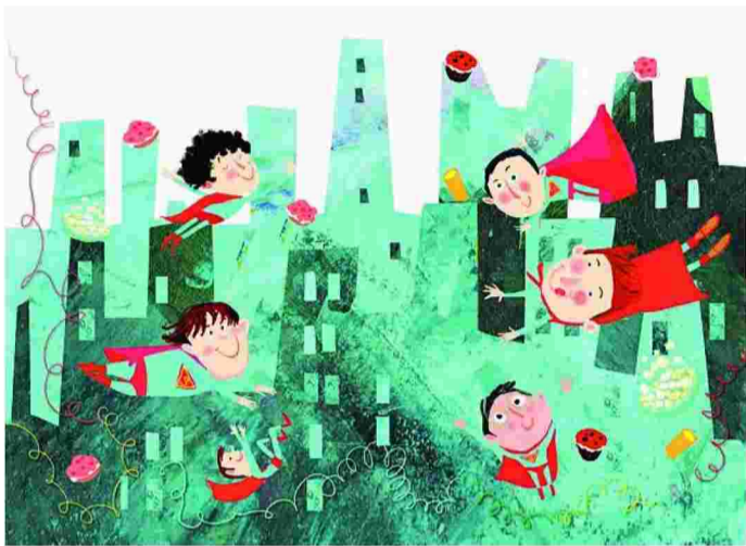
Το έξυπνο και κιομοριστικό βιβλίο «Ζητείται άλογο για αμαζόνα» απευθύνεται σε παιδιά γύρω στα επτά.

Όμως, αν θέλουμε να είμαστε ειλικρινείς, η μεταμόρφωση είναι, μέχρι και την εφηβεία, υπόθεση ελαστική. Είναι μια φυσική τάση, που δεν περιορίζεται, βέβαια, στις Απόκριες. Όσο η ταυτότητα παραμένει ρευστή και εύπλαστη, τόσο πιο αυτονόητες μοιάζουν – και είναι! – η θεατρικότητα και η μεταμόρφωση.