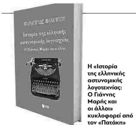
Η «Ιστορία της ελληνικής αστυνομικής λογοτεχνίας: Ο Γιάννης Μαρής και οι άλλοι» κυκλοφορεί από τον «Πατάκη»

“Απογευματινή”, είτε αγοράζοντας τα βιβλία τσέπης του οίκου Ατλαντίς-Πεχλιβανίδης. Σιγά σιγά, κατάφερα να σχηματίσω μια μικρή βιβλιοθήκη με αστυνομικά περιοδικά και βιβλία, μαζί βεβαίως με βιβλία πιο σοβαρά, του Καζαντζάκη, του Ντοστογιέφσκι, του Ιουλίου Βερν, του Άρθουρ Σοπενχάουερ.