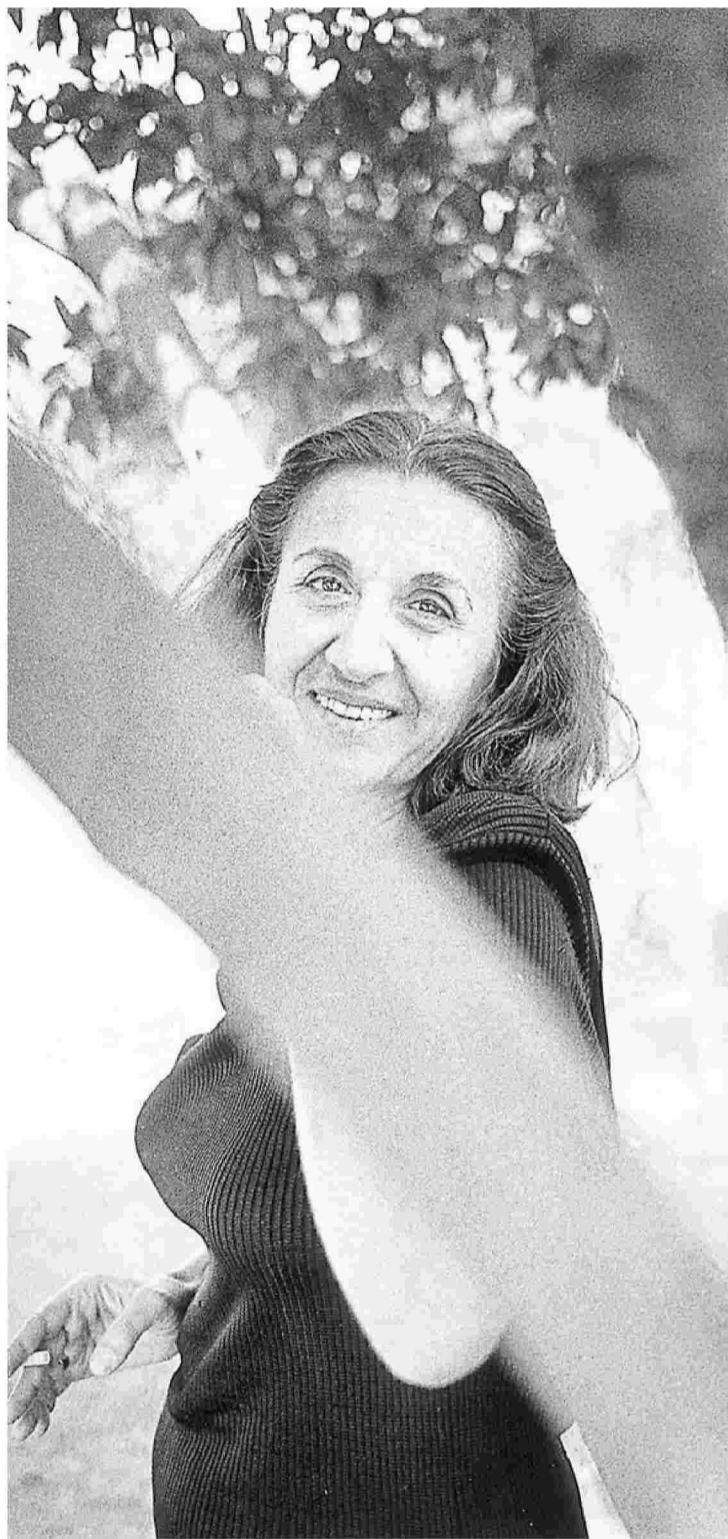
Το νέο μυθιστόρημα από την πεζογράφο Μάρω Δούκα κινείται μέσα στο ακανές του κυβερνοχώρου, αλλά και στην Αθήνα τού σήμερα.

ρίς να το έχω αποφασίσει συνειδητά, ποτέ άλλωστε ο συγγραφέας δεν προαποφασίζει – άρχισα να ακολουθώ τον βηματισμό και τη ματιά μιας γυναίκας περίπου στην ηλικία μου για τον απλούστατο λόγο ότι δεν ήθελα να μπλεχτώ με πραγματολογικά στοιχεία που θα έπρεπε να ερευνησω. Ηθελα να την «οπλίσω», να την «προκίσω» με όσα εγώ θα μπορούσα να θυμηθώ. Κι άρχισα λίγο λίγο να τη βλέπω, να την επινοώ: Μια καθημερινή, συνηθισμένη γυναίκα, καλόβολη, καλοπροαίρετη, με τα μυστικά και τις εμμονές της, σαν όλους τους κανονικούς, φυσιολογικούς ανθρώπους. Κι αυτή η επινοημένη γυναίκα, έρχεται ανεπισημάτως η στιγμή που διαχέεται σε πολλά άλλα πρόσωπα (επινοημένες επίσης περσόνες). Πάντα σ' ένα δι-