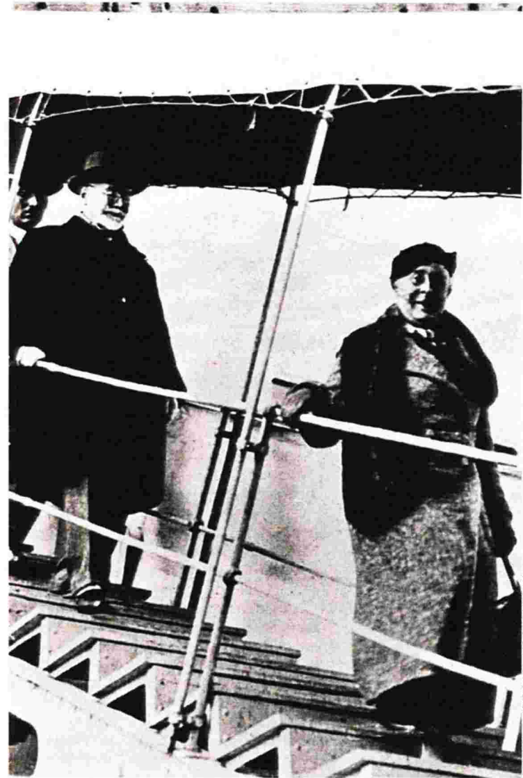
Ο Ελευθέριος Βενιζέλος και η σύζυγός του Ελενα αποβιβάζονται από το πλοίο σε ταξίδι τους στην Ιταλία

Θα έλεγε κανείς, και εδώ είναι η ουσία, ότι ο συγγραφέας επιχειρεί ευρύτερα μια ετεροχρονισμένη «αυ-