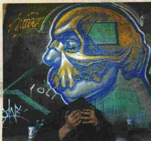
Σύγχρονο γκραφίτι σε αθηναϊκό τοίχο με θέμα την απόγνωση