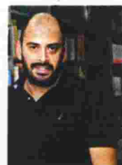
Του Γιάννη Τσίρμπα

Η συγκεκριμένη φράση, με την οποία ξεκινά «Η Βικτώρια δεν υπάρχει», κατά μία έννοια