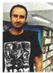
Του Ιάκωβου Ανουφαντάκη

Καλοκαίρι του 2009 ξεκινάνε οι «Αλεπούδες στην πλαγιά», καλοκαίρι του 2009 ξεκίνησα να γράφω το βιβλίο.