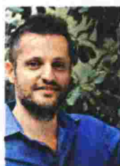
Του Γιάννη Πηλιάγκου

«Ενα τρίτο αλήθεια και δύο τρίτα ψέματα» μυθιστόρημα, Νεφέλη