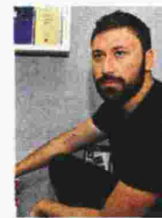
Του Δημήτρη Τανούδη

ρισμα της ελπίδας. Αν' τον χωμάτινο τάφο μιας γυναίκας εκλύεται ένα μαγικό φως, πλημμυρίζοντας τους κατοίκους κι αλλάζοντας τις θεμελιακές ροές του πολιτισμού. Οι άνθρωποι ζουν για αιώνες μέσα σε γαλήνη. Ωστόσο, μια λέξη, γραμμένη σε κοινή θέα, αρκεί για να εμβολίσει τον φόβο. Ποιοι είναι οι κρυφοί αρωγοί της ελπίδας; Τα βλέμματα των ανθρώπων στρέφονται αντίπερα, εκεί όπου ένας άλλος λαός, οι παρείσακτοι, οι τρελοί και θλιμμένοι, έχουν εξοριστεί. Αποφασίζουν να τους αφανίσουν, εκμηδενίζοντας έτσι την πιθανότητα