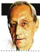
ΓΡΑΦΕΙΟ ΦΙΛΙΠΠΟΣ Δ. ΔΡΑΚΟΝΤΑΙΔΗΣ

Σ τη ρωσική εκκλησία της Αγίας Βαρβάρας στο Βεβέ της Ελβετίας δεν έλειπαν, ως τα μέσα του 1970, αφορμές για μνημόσυνα στη μνήμη της οικογένειας των Ρομανόφ: γιορτές αγίων, επέτειοι νίκης, γεννήσεις, γάμοι, καλές και κακές στιγμές γραμμένες στο ημερολόγιο γλιτώνων από τη λήθη. Υπέργηροι παρασημοφορημένοι στρατηγοί του τσαρικού στρατού συνοδευόμενοι από υπερήφανες συζύγους, γιους και εγγόνια, ευπαρουσίαστοι μεσόκοποι απόγονοι μελών της αυτοκρατορικής Αυλής και της αριστοκρατίας, μέλη του υπηρετικού προσωπικού εξεχόντων μελών της πολιτικής και οικονομίας της χαμένης πατρίδας έψελναν ευλαβικά και δάκρυζαν στο άκουσμα των δεήσεων για την ανάπαυση της ψυχής του τσάρου Νικόλαου Β', της τσαρίνας και των παιδιών τους. Μετά από τέτοια σεμνή τελετή, οι πιστοί επισκέπτονταν το μικρό νεκροταφείο πίσω από την εκκλησία και κατέθεταν λουλούδια στους τάφους επιφανών κατά τη γνώμη τους Ρώσων που είχαν αφήσει την τελευταία πνοή τους σε ξένο τόπο.