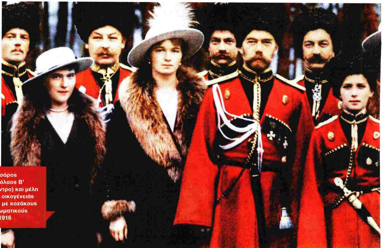
Ο τσάρος Νικόλαος Β' (κέντρο) και μέλη της οικογένειάς του με κοζάκους αξιωματικούς το 1916

Η απαρίθμηση των γεγονότων είναι γνωστή, όπως γνωστό είναι ότι ο Νικόλαος Β' ήταν κοντός, έδειχνε όμως μεγαλοπρεπής στις επίσημες ολόσωμες φωτογραφίες, κοντός