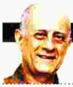
ΓΡΑΦΕΙΟ ΓΙΩΡΓΟΣ ΒΕΣΣ

Ο βραβευμένος διηγηματογράφος και συνεκδότης του περιοδικού «Το Δέντρο», που επανήλθε με τη συλλογή «Απόσταση αναπνοής», υπηρετεί με συνέπεια και μοναδικότητα για τον ελληνικό χώρο ένα είδος πεζογραφίας που σπάει τις κλασικές φόρμες