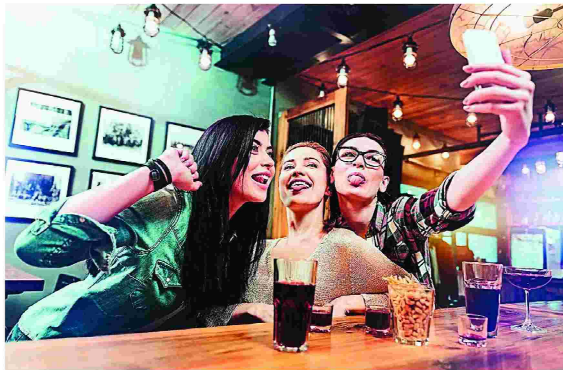
Η Ρούνεϊ γράφει για τη γενιά των millennials. Αλλωστε είναι και η ίδια μέλος της. Χιλιάδες συνομήλικοί της βρήκαν στις σελίδες της τους εαυτούς τους. Τις συνήθειες και τις ανησυχίες τους.

Οι δύο πρωταγωνίστριες, οι 21χρονες φοιτήτριες Φράνσις (αφηγέτρια) και Μπόμπι, τελείωσαν όπως και ο Δαίδαλος ένα θρησκευτικό σχολείο, το οποίο, καθώς λένε, «δημιούργησε διάφορα ζητήματα», όπως ότι η μία έγινε κομμουνίστρια και η άλλη ομοφυλόφιλη. Η Φράνσις δηλώνει ότι «δεν πρόκειται ποτέ να πιάσω δουλειά» και δικαιολογείται λέγοντας ότι «ποτέ δεν ήθελα να βγάζω χρήματα κάνοντας κάτι». Λέει επίσης ότι μισεί την εξουσία «επειδή απεχθάνομαι να μου λένε τι να κάνω» και ότι είναι «κατά της αγάπης αυτής καθεαυτήν». Όσο για την ασήκωτη σκιά του καθολικισμού που σκέπαζε την προσωπικότητα του Τζόις, η Φράνσις την υποδέχεται ως μια κατάσταση παρωχημένη: «Η μητέρα μου με πύγαινε κάθε Κυριακή στη λειτουργία ως τα δεκατέσσερά μου, αλλά δεν πίστευε στον Θεό και αντιμετώπιζε τη λειτουργία σαν ένα κοινωνικό τελετουργικό πριν από το οποίο με έβαζε να λούζομαι».