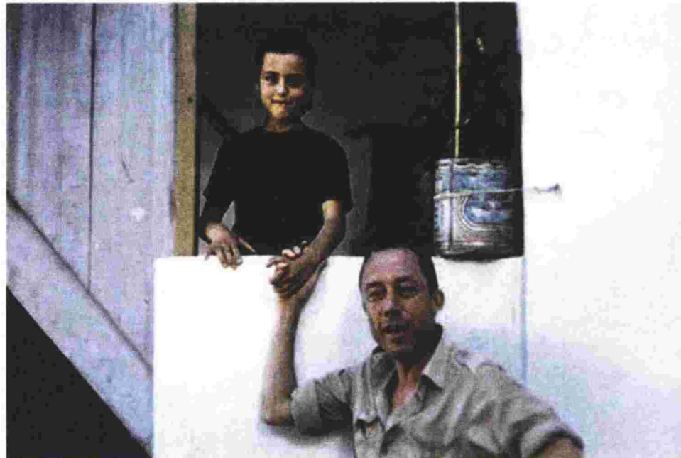
Ο Καμύ με την κόρη του Κατρίν κατά τη διάρκεια του δεύτερου ταξιδιού του στην Ελλάδα το 1958.

Απέναντι στον γεμάτο αθλιότητες κόσμο, «η μόνη δικαιολογία του θεού είναι ότι δεν υπάρχει», είχε