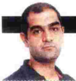
ΓΡΑΦΕΙΟ ΔΗΜΗΤΡΗΣ ΔΟΥΛΓΕΡΙΑΔΗΣ

Ο δημιουργός των ντετέκτιβ Νικ Στέφανος και Σπίρο Λούκας αυτοαναλύεται πριν από την ομιλία του στην Αθήνα