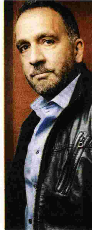
Ο συγγραφέας Τζορτζ Πελεκάνος

Λίγο προτού έρθει στην Ελλάδα ο μεγάλος συγγραφέας αστυνομικής λογοτεχνίας μιλάει στο «Βήμα» για το νέο του βιβλίο «Το δίδυμο»