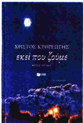
ΧΡΙΣΤΟΣ ΚΥΘΡΕΩΤΗΣ «Εκεί που ζούμε» Μυθιστόρημα, σελ. 440 Εκδόσεις Πατάκη

Της Κατίνας Βλάχου , ποιήτριας-συγγραφέως