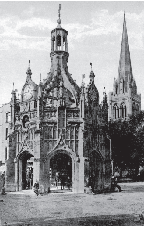
Market Cross και καθεδρικός ναός στο Chichester.

η γύρη, η ευτυχία αυτή κολλούσε πάνω σε όποιον ερχόταν σε επαφή μαζί τους. 1* Ο Harold και η Essie εύχονταν στα παιδιά τους να διασκεδάζουν και να νιώθουν γεμάτα, μεταδίδοντάς τους το ξεκάθαρο αν και άρρητο μάθημα ότι θα μπορούσαν να κάνουν και να είναι σχεδόν οτιδήποτε ήθελαν, αρκεί να το έκαναν με πάθος και ευφυΐα.