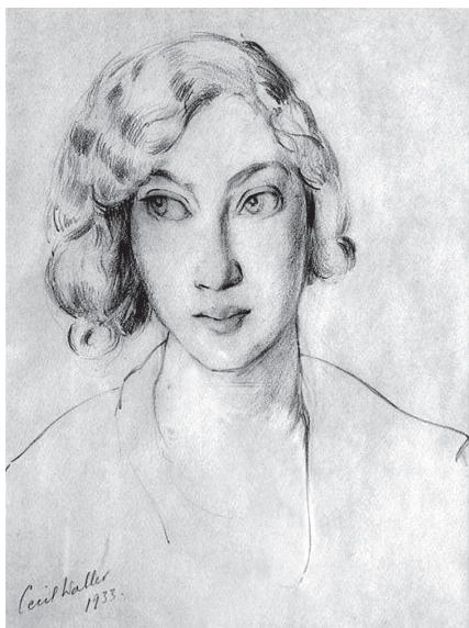
«Nina Milkina» του Cecil Waller, 1933. Μολύβι σε χαρτί, 48,5 × 34,5 εκ. Tallis Foundation, Αυστραλία.

ή βραδινό – και, στην περίπτωση που τους έπιανε πείνα ανάμεσα στα μαθήματα, ένα τροχήλατο τραπεζάκι με τα απομεινάρια διαφόρων γευμάτων (πίτα του βοσκού, φαιόχρωμες αγνώστου ταυτότητας και προελεύσεως μπουκιές και μια ξινή άσπρη ουσία που για πολλούς αποτελούσε την πρώτη