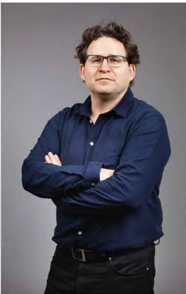
Ο Βόλφραμ Αϊλενμπέργκερ.

— Τι είναι αυτό που κάνει τόσο ξεχωριστή την περίπτωση του Βιγκενστάιν, σε σημείο που ο Κέινς να αναφωνεί «Ο Θεός ήρθε. Τον είδα στο τρένο των πάντων και τέταρτο»;