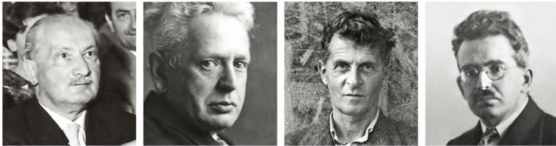
Από αριστερά, Μόρτιν Χάντεγκερ, Ερνστ Κασίρερ, Λούντβιχ Βιγκενστάιν και Βάλτερ Μπένγιαμιν. Το έργο και η ζωή των τεσσάρων γιγάντων της φιλοσοφίας του 20ού αιώνα παρακολουθεί στο βιβλίο του ο Αϊλενμπέργκερ.