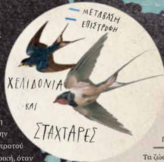
ΧΕΛΙΔΟΝΙΑ ΚΑΙ ΣΤΑΧΤΑΡΕΣ — ΜΕΤΑΒΑΣΗ — ΕΠΙΣΤΡΟΦΗ

ΧΕΛΙΔΟΝΙΑ ΚΑΙ ΣΤΑΧΤΑΡΕΣ Αυτά τα χαριτωμένα και ταχύτατα πουλιά μεταναστεύουν από την Ευρώπη στην Αφρική για τον χειμώνα, μια απόσταση 22.000 χλμ. Μένουν στην Ευρώπη το καλοκαίρι προτού επιστρέψουν στην Αφρική, όταν αρχίσει να μειώνεται ο πληθυσμός των εντόμων.