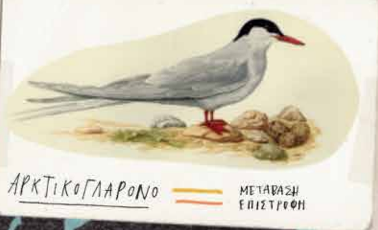
ΑΡΚΤΙΚΟΓΛΑΡΟΝΟ — ΜΕΤΑΒΑΣΗ — ΕΠΙΣΤΡΟΦΗ

Το ΑΡΚΤΙΚΟΓΛΑΡΟΝΟ ταξιδεύει από την Αρκτική στην Ανταρκτική, πάνω από 70.000 χιλιόμετρα, ξεκινώντας το ταξίδι του τον Αύγουστο ή τον Σεπτέμβριο κι επιστρέφοντας ξανά στον τόπο του τον Μάιο ή τον Ιούνιο. Μεταναστεύουν ακολουθώντας τον θερινό ήλιο, καθώς αλλάζουν οι εποχές.