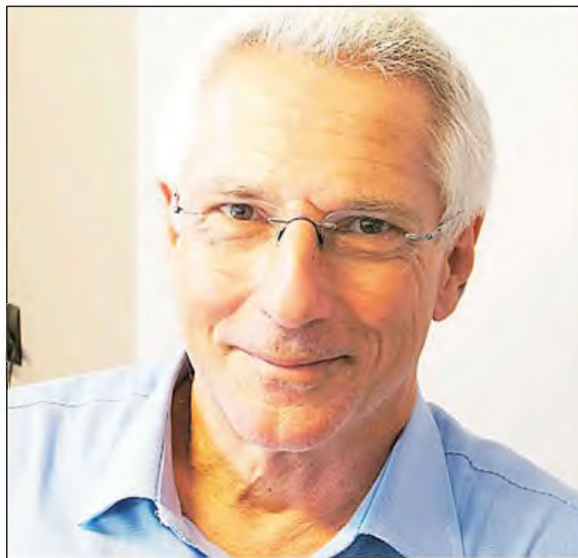
Ιστορικά -αλήθια και τα περί τους θεσμούς ή τις πολιτικές δομές- βιβλία μου.

Την Ιστορία δεν μπορεί να την (ξανα)γράψει ένα άτομο. Αυτό το κάνει η πνευματική ορίμανση της κοινωνίας, όταν την καθιστά ικανή να καταβάσει καταστάσεις τους μύθους και τους δαιμόνες της. Ο Βενεζέλος ήταν και το δόο. Σε αυτό προσπαθώ να έχω μια μικρή συμβολή με το όλο έργο μου, κυρίως με τα