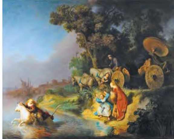
↑ Η αρπαγή της Ευρώπης διά χειρός Ρέμπραντ (1632, Μουσείο Τζ. Πολ Γκέτι, Λος Άντζελες)

Αν και ανοίκει σε εμάς, το τοπίο αυτό παρέχει ήδη την αίσθηση της κοινότητας που θα αθίσει στη συγκρότηση μιας παράδοσης οκέφνης που προτείνει την εννοποίηση του γεωγραφικού και πολιτικού χώρου. Από το De Monarchia του Δάντη τον 14ο αιώνα ως το Le Grand Dessein του δούκα ντε Συλί τον 17ο και με πολύ με-