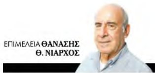
ΕΠΙΜΕΛΕΙΑ ΘΑΝΑΣΗΣ Θ. ΝΙΑΡΧΟΣ