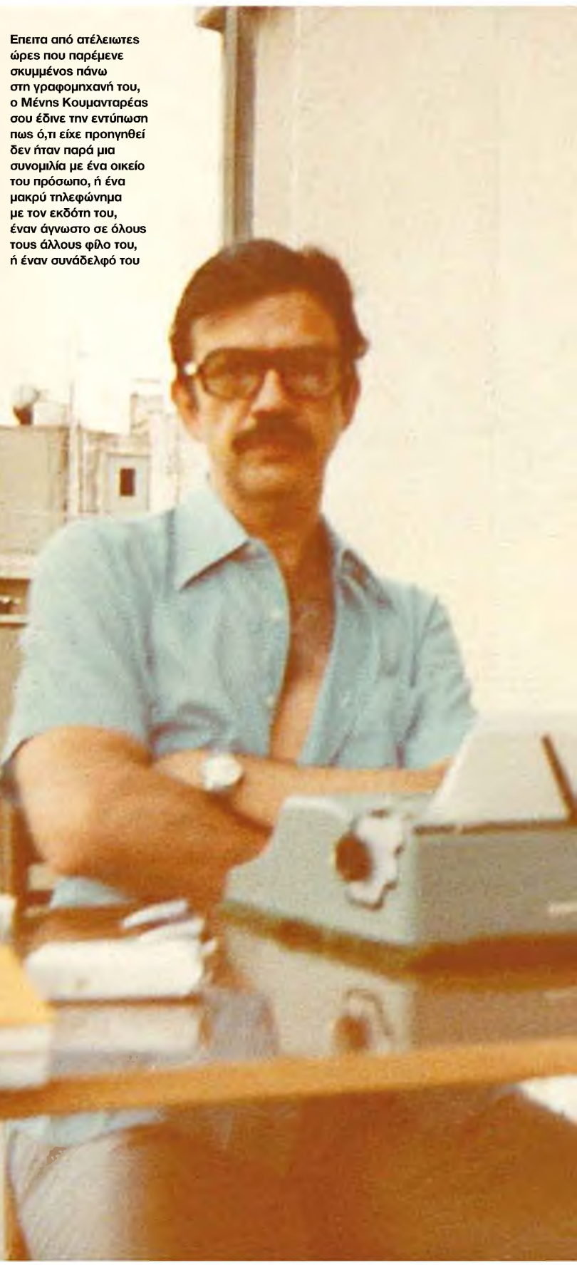
Επετα από στέλιωτες ώρες που παρέμενε σκυμμένος πάνω στη γραφομηχανή του, ο Μένης Κουμανταρέας σου έδινε την εντύπωση πως ό,τι είχε προηγηθεί δεν ήταν παρά μια συνομιλία με ένα οικείο του πρόσωπο, ή ένα μακρύ τηλεφώνημα με τον εκδότη του, έναν άγνωστο σε όλους τους άλλους φίλο του, ή έναν συνάδελφό του