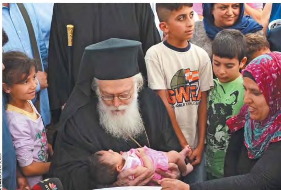
▶ Από την επίσκεψη του Αναστάσιου στο κέντρο φιλοξενίας προσφύγων στο Κουτσόχερο της Λάρισης

Κάθε Κυριακή, μα κάθε Κυριακή, ο ναός της Αναστάσεως στο κέντρο των Τίρανων γέμιζε ασφυκτικά. Και