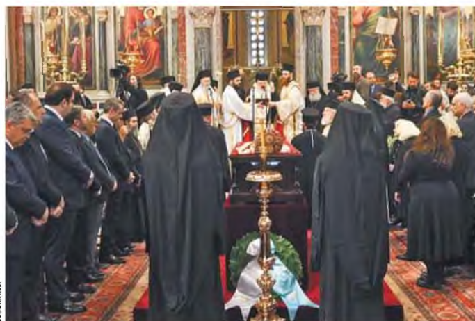
▶ Στη Μητρόπολη Αθηνών τελέσθηκε τρισάγιο υπέρ της αναπαύσεως της ψυχής του μακαριστού Αρχιεπισκόπου Τιράνων, Δυρραχίου και πάσης Αλβανίας, Αναστασίου

Σε κλίμα συγκίνησης, παρουσία της πολιτικής και πολιτειακής ηγεσίας της χώρας, τελέστηκε χθες το πρωί, στη Μητρόπολη Αθηνών, τρισάγιο υπέρ της αναπαύσεως της ψυχής του μακαριστού Αρχιεπισκόπου Τιράνων, Δυρραχίου και πάσης Αλβανίας Αναστασίου. Το τρισάγιο τέλεσε ο Αρχιεπίσκοπος Αθηνών και Πάσης Ελλάδος Ιερώνυμος, ενώ προηγήθηκε Θεία Λειτουργία προεξάρχοντος του Μητροπολίτη Ναυπάκτου και Αγίου Βλασίου, Ιερρόθεου.