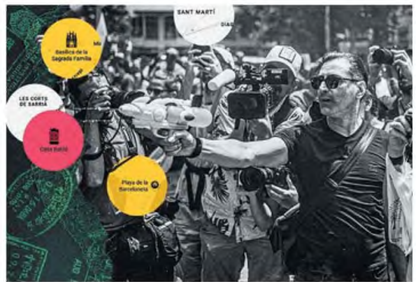
ILLUSTRATION TO BHMA

καταβρεχόμενος, καθότι μπορεί ο ίδιος να είναι ο τουρίστας, μια ακόμη ανθρώπινη ψηφίδα από εκείνες που οχηματίζουν το μωσαϊκό των υπερ-τουριστικών σιφών. Ποιος από εμάς δεν θέλησε να δει τη Ρώμη, το Παρίσι, τη Βενετία και ποιος από εμάς, με μια κάποια αλαζονεία, δεν επιρείται πως, ναι, μπορεί να ταξιδεύει για αναψυχή, αλλά, όχι, προς Θεού, δεν ανήκει στην «τουριστική μάζα»; Ένας τέτοιος αυτάρεκος εξαιρετισμός (είμαι «ταξιδιώτης»), δεν απαγοίαι στον μαζικό τουρισμό) δεν αρκεί για να μη φας τη σταγόνα κατά πρόσωπο από τον κάτοικο μιας πόλης που υποφέρει εξαιτίας της ανάλωσης του βαλαντιού σου στα Αίθνη, τις ανακαινισμένες καφετέριες