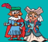
Ο ΛΟΡΔΟΣ ΚΑΙ Η ΛΑΙΔΗ