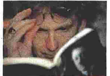
Ο ιστορικός και μελετητής του Ολοκαυτώματος Τίμοθι Ράιμπακ παρουσιάζει τη «Βιβλιοθήκη του Χίτλερ»

«Η ΒΙΒΛΙΟΘΗΚΗ ΤΟΥ ΧΙΤΛΕΡ. ΤΑ ΒΙΒΛΙΑ ΠΟΥ ΕΠΗΡΕΑΣΑΝ ΤΗ ΖΩΗ ΤΟΥ» ΤΙΜΟΘΙ ΡΑΪΜΠΑΚ