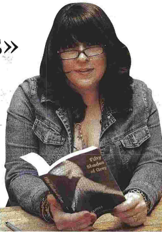
Η Ε. Λ. Τζέιμς υπογράφει αντίτυπα του μπεστ σέλερ της «Πενήντα αποχρώσεις του γκρι», στα τέλη του περασμένου Απριλίου

Το πρώτο μέρος της σαδομαζοχιστικής τριλογίας που έγραψε μια 49χρονη βρετανή μητέρα και το οποίο καταρρίπτει όλα τα ρεκόρ της εκδοτικής αγοράς