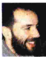
Γράφει ο Νικόλαος Ζώης

Η «Νίκη» είναι η ιστορία ενός κοριτσιού γεννημένου σε μια οικογένεια αφοσιωμένη στην κοινωνική δικαιοσύνη. Ενός κοριτσιού που αναπνέει αέρα εξορίας σε βρεφική ηλικία, χρησιμοποιεί ψεύτικο όνομα νωρίτερα από το συνηθισμένο ή που το σχεδόν πολυκομματικό σόι του αναμετρείται με την Ιστορία της μεταπολεμικής Ελλάδας. Το μεγαλύτερο «κακό» που επιφυλάσσει σε ένα παιδί ένα τέτοιο περιβάλλον είναι, για τον συγγραφέα, να συμπεριληφθεί και εκείνο στις οικογενειακές ταλαιπωρίες, «να μην μπορέσει να πάρει αποστάσεις, ώστε να πλάσει τη δική του προσωπικότητα και αντ' αυτού να καταλήξει γόνος, ακνή φωτοτυπία των γονιών του». Η Νίκη ωστόσο τα καταφέρνει με όλο τον έρωτα, μήπως επομένως υπερβάλλουμε στην ασφυκτική δύναμη που αποδίδουμε στην Αριστερά; «Μα δεν είναι η