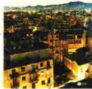
Τηλέμαχος Κώτσιας ΟΙ ΔΕΙΝΟΣΑΥΡΟΙ ΤΩΝ ΑΘΗΝΩΝ ΤΑΞΙΔΙ ΣΕ ΛΑΘΟΣ ΧΩΡΑ

Εκδ. Πατάκη, 2015 Σελ. 176 Τιμή: 9,50 ευρώ