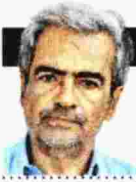
ΓΡΑΦΕΙ Ο ΜΙΧΑΛΗΣ ΜΟΛΙΝΟΣ

Δέκα διεγερτικά και διδακτικά δοκίμια που αναδεικνύουν το πάθος για τη μορφή και την τεχνική που είχε η Βρετανίδα ιέρεια του μοντερνισμού, η οποία αυτοκτόνησε πριν από 75 χρόνια, στις 28 Μαρτίου 1941