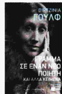
Virginia Woolf ΓΡΑΜΜΑ ΣΕ ΕΝΑΝ ΝΕΟ ΠΟΙΗΤΗ ΚΑΙ ΑΛΛΑ ΚΕΙΜΕΝΑ

βιβλίου: ο Πλάτωνας, ο Σαίξπηρ, ο Καρλάιλ, η Οστιν, ο Τολστόι, ο Φλομπέρ, ο Ντίκενς, ο Λόρενς, ο Φόρστερ, ο Ελιοτ και βεβαίως οι σύγχρονοι της Προυστ, Τζόις, και Χέμινγουεϊ, εμφανίζονται και αποσύρονται προκειμένου να τονίσουν τη συλλογιστική της συγγραφέως, να συμπαραταχθούν νοερά μαζί της, να φανερώσουν αν την έχουν επηρεάσει και πόσο. Μέσω αυτών η Γουλφ θα θίξει τα αιώνια ζητήματα της συγγραφής (έμπνευση, πλοκή, θεματικές γραμμές, μορφή, ύφος, αφηγηματικοί ήρωες), θα συγκρίνει σχολές σκέψης, θα αναλύσει τον φυσικό και κοινωνικό περίγυρο που διαμορφώνει τη συνείδηση των γραφιάδων, θα επισκοπήσει με εξαιρετική διαύγεια σημαντικές περιόδους και ρεύματα της λογοτεχνίας. Φέρ' ειπείν, το δοκίμιο της «Γράμμα σε έναν νέο ποιητή», που δίνει τον τίτλο της στην παρούσα συλλογή, απαντά στο ερώτημα των δυσχερειών μιας ποιητικής σύλληψης του κόσμου στη συγκεκριμένη χρονική περίοδο αλλά και