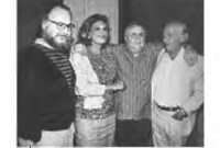
Με τη Μελίνα Μερκούρη, τον Μάνο Χατζιδάκι και τον Ζώνη Ντασοέν.

1986 Παραχωρεί στην ΕΡΤ την εκπομπή «Ζήτω το ελληνικό τραγούδι».