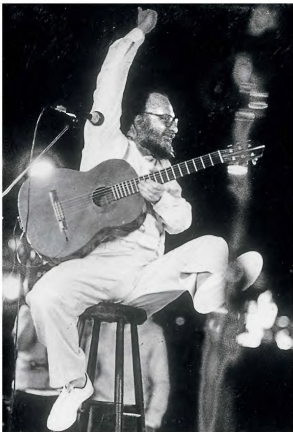
Ο Διονύσης Σαββόπουλος στη σκηνή του ΟΑΚΑ, το 1983 στη μεγάλη συναυλία που έδωσε μετά την κυκλοφορία του δίσκου του «Τραπεζάκια έξω», ο οποίος περιλαμβάνει τραγούδια που έγιναν ύμνος στα χείλη όλων των Ελλήνων, όπως το «Ας κρατήσουν οι χοροί». Κάθε ψηφίδα της καλλιτεχνικής του έκφρασης έχει και τη δική της διαδρομή.

Με κουρέψανε γουλί, με ντύσανε, κι εγώ τους έκανα τον χαζό, πράγμα που δεν μου είναι δύσκολο, μου βγαίνει πολύ φυσικά. Καί τα έχω, δεν μπορεί. Μ' έβγαλαν εκτός ασκιοεών και μου είπαν να περμόνω να έρθει η επιτροπή. Τρεις μέρες στον θάλασο δεν έβλεπα μπίτι με όλαν εκείνη τη σαματατζίκια φαντασία. Εχω που μου την πυροδοτούσαν δύο πράγματα: ένα παραδοσιακό μοτίβο από την Ουγγαρία που μου το 'μαθε ο καθαριστής μου Γιάννης Λαμπιτί η Τζόνι. Μου είχε κολλήσει και δεν ξεκόλλαγε. Και επίσης ο στίχος «Εδώ είναι Βαλκάνια, δεν είναι παιζε-γέλασε» απ' τον Νικο Εγγονόπουλο, από το «Όρνεον 1748», από εκεί που λέει «Μίρκο Κράλη, τι ζήτ'ας; εδω δεν είναι παιζε γέλασε; / εδω είναι Μπαλκάνια».