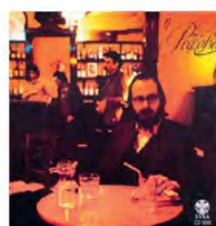
Εξι δίσκοι από την πλούσια δισκογραφία του Διονύση Σαββόπουλου. Περιλαμβάνουν τραγούδια που γράφτηκαν υπό τον σκληρό έλεγχο της λογοκρισίας, τις πρώτες ημέρες της θείας του καλλιτέχνη, στο Παρίσι και στην καλοκαιρινή Αθήνα.