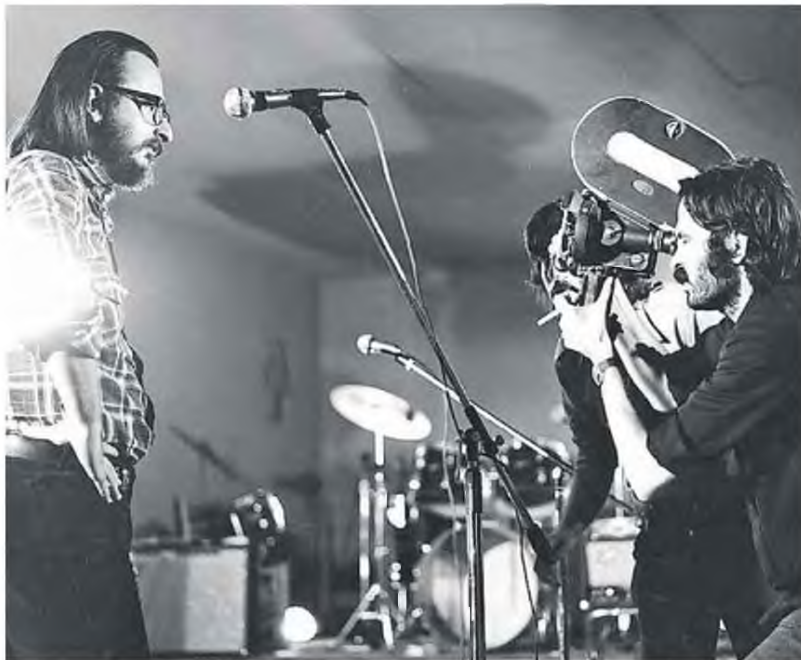
▶ Ο Λάκης Παπαστάθης κινηματογραφεί τον Διονύση Σαββόπουλο στο «Κύτταρο» για το ντοκιμαντέρ του «Χαίρω πολύ, Σαββόπουλος» (1975)

(Από το «Διονύσης Σαββόπουλος», εκδ. Μεταίχμη, β' έκδοση αναθεωρημένη, 2025)