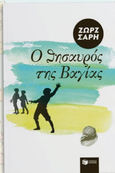
«Ο θησαυρός της Βαγίας» της Ζωρζ Σαρή