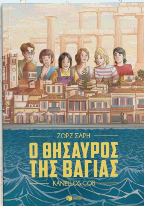
«Ο θησαυρός της Βαγίας» σε Graphic Novel από τον Kanellos Cob