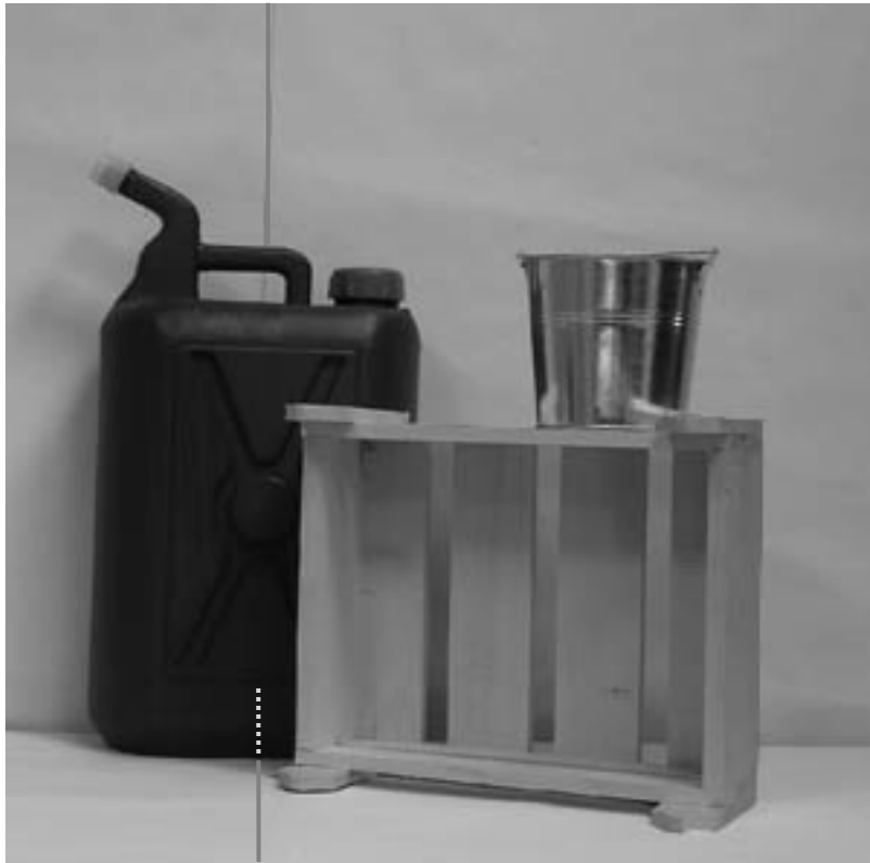
Πρώτη φωτογραφία : Μπροστινή όψη