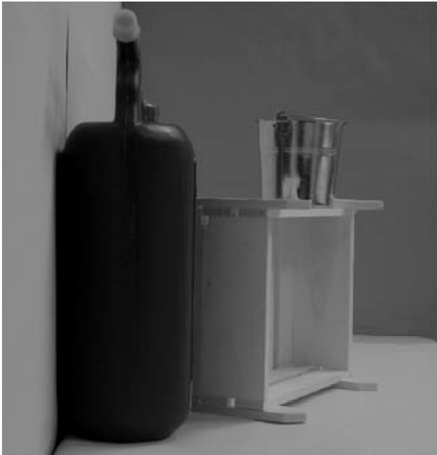
Τρίτη φωτογραφία : Πλάγια όψη