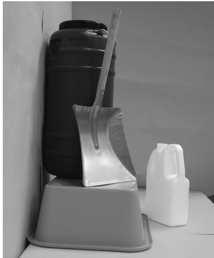
Τέταρτη φωτογραφία: Πλάγια όψη