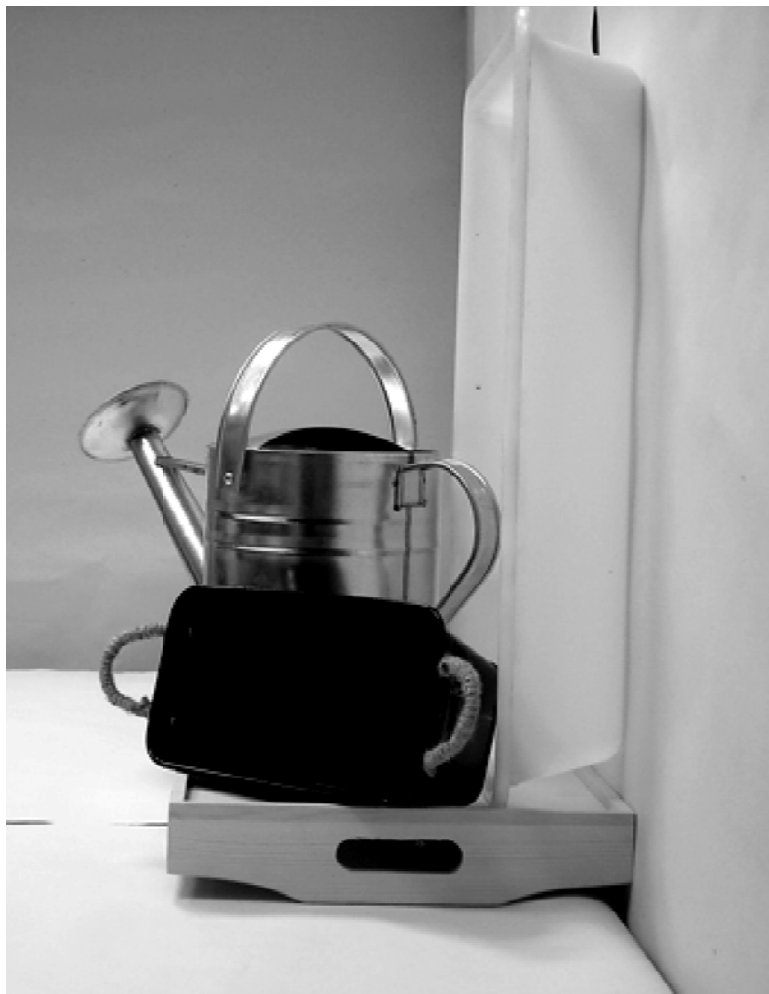
τέταρτη φωτογραφία: πλάγια όψη