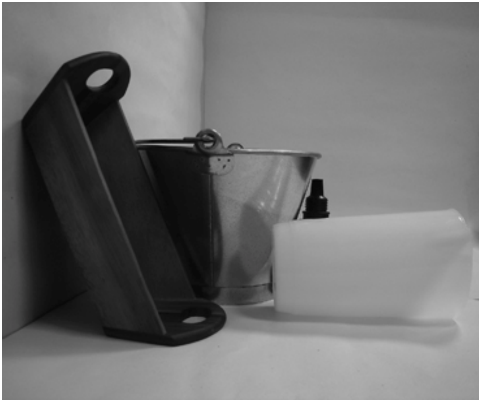
τρίτη φωτογραφία: πλάγια όψη