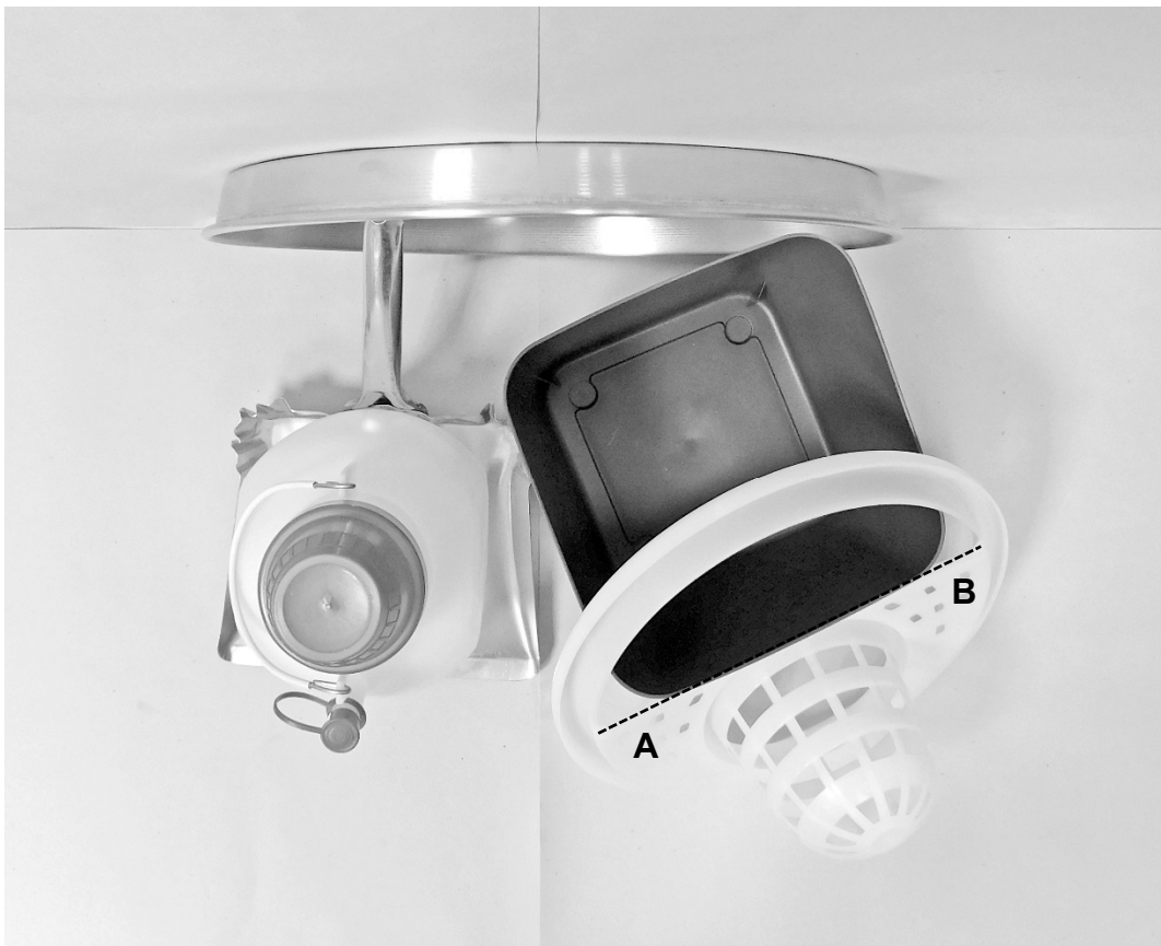
δεύτερη φωτογραφία: κάτοψη