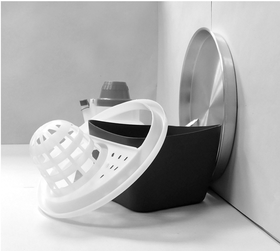
τέταρτη φωτογραφία: πλάγια όψη 2