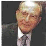
Το Βραβείο Μυθιστορήματος πήρε ο Γιώργος Λεονάρδος.

Τα Κρατικά Βραβεία Λογοτεχνίας για το έτος 2008 απονεμήθηκαν ως εξής: Βραβείο Ποίησης στη Δήμητρα Χριστοδούλου («Λιμός», Εκδ. Νεφέλη). Βραβείο Διηγήματος στην Ευγενία Φακίνου («Φιλοδοξίες κήπου», Εκδ. Καστανιώτη). Βραβείο Μυθιστορήματος στον Γιώργο