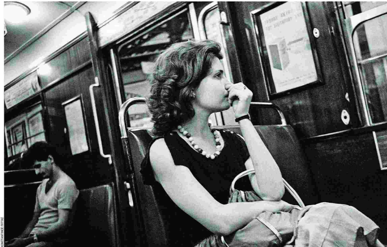
Γυναίκα στον ηλεκτρικό της Αθήνας, δεκαετία του '80. Φωτογραφία του Κωνσταντίνου Πίττα από το βιβλίο του «Αθήνα, πόλη των γυναικών» (έκδοση 2017).

«Η κυρία Κούλα» με τη νέα εξοδό της στα βιβλιοπωλεία αλλά και στο θέατρο, όπως και η «Βιοτεχνία Υαλικών», που μεταφέρει όλη την πνι-