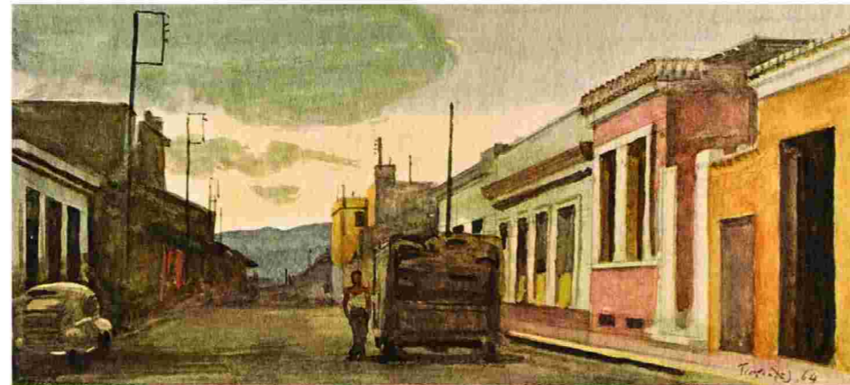
Γιάννης Τσαρούχης , «Σπίτια κοντά στην οδό Πειραιώς» (ΑΓΕΤ-Ηρακλής, 1964). Η ατμόσφαιρα της «Βιοτεχνίας Υαλικών».

χτή ατμόσφαιρα από το Γκαζοχώρι, εξακοντίζουν στο σήμερα την αθηναϊκή μυθολογία με ένα τρόπο αιφνιδιαστικά επίκαιρο. Τα σαράντα χρόνια που μας χωρίζουν από τη δεκαετία του '70 οδηγούν το βλέμμα μπρος και πίσω. Η αθηναϊκή γραφή του Κουμανταρέα, γέννημα του μεταπολιτευτικού οίστρου, ανανέωνε το αστικό συνεχές που κορυφωνόταν